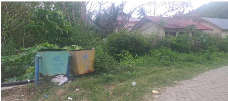
Gambar 2. Salah satu Tempat Sampah Umum yang tersisa dalam kondisi rusak

Pengadaan sarana dan prasana berupa fasilitas tempat sampah dan layanan mobil sampah belum maksimal hingga saat ini terbukti dengan proses yang terjadi di lingkungan masyarakat Talumolo seperti pengadaan tempat sampah sekarang tidak ditemukan pada pemukiman warga. Hal ini didasarkan pada pengamatan yang dilakukan di beberapa Rt/Rw yang menunjukkan tidak ditemukannya tempat sampah umum yang biasa di letakkan pada area publik dan pemukiman masyarakat. Masyarakat hanya menggunakan tempat sampah pribadi dirumahnya untuk menampung sampah sementara sampai mobil sampah lewat dan mengangkutnya. Perilaku ini muncul akibat tidak tersedianya sarana dan prasarana yang menunjang ketersediaan sarana dan prasarana menjadi menjadi faktor utama yang memicu perilaku membuang sampah sembarangan. Hal ini sejalan dengan penelitian yang dilakukan (Mereike D & Astri J, 2018) yang menyebutkan kebiasaan masyarakat dalam membuang sampah di Sungai dipengaruhi oleh ketersediaan sarana dan prasarana yang ada.