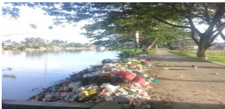
Gambar 3. Tempat Pembuangan Sampah di Bantaran Sungai Bone

Tahapan berikutnya merupakan imitasi sosial pada masyarakat akibat keadaan terdesak karena tidak merasakan fasilitas tempat sampah umum membuat masyarakat memilih untuk mengumpulkan sampah di satu tempat untuk dibakar dan adapun langsung membuangnya di Bantaran Sungai Bone. Hal ini dilakukan karena petugas belum mengangkut sampah dalam waktu yang lama kemudian agar sampah tidak membusuk di dalam rumah dibakar atau dibuang sembarangan di Sungai. Inilah yang menjadi awal timbulnya kebiasaan masyarakat membuang sampah di Bantaran Sungai. Perilaku menyimpang ini disaksikan oleh satu atau dua orang hingga akhirnya dilakukan setiap orang. Bahkan sampai sekarang akibat dari perilaku ini membuat pemandangan sungai menjadi tidak sedap dipandang karena banyaknya sampah dengan bau busuknya mengotori sepanjang bantaran sungai Bone. Seperti yang ditunjukkan pada (Gambar 3) di bawah ini: